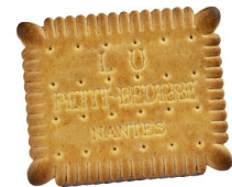
Petit-Beurre (biscuit de Nantes)

On n'avait rien oublié, c'est maman qui a tout fait Elle avait travaillé pour sans s'arrêter Pour préparer les paniers, les bouteilles, les paquets Et la radio !