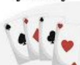
A deck of cards