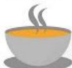
A bowl of soup